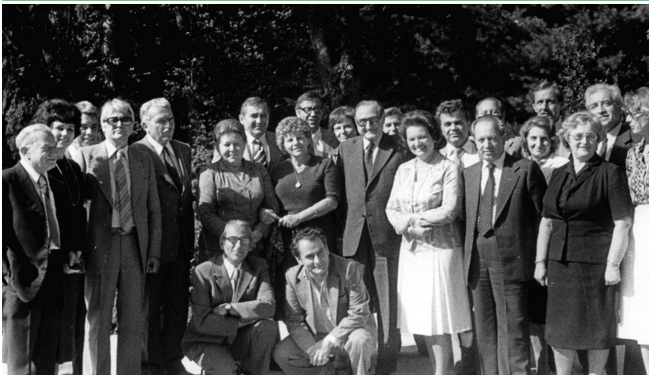
Slika 1. Srečanje predstavnikov farmacevtskih društev Jugoslavije s konca 70. let dvajsetega stoletja v Sloveniji. Med njimi je devet predstavnikov Slovenskega farmacevtskega društva.