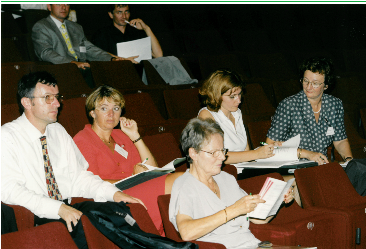
Slika 4: V pripravi na nadaljevanje simpozija na 3. CESPT v Portorožu 1999.