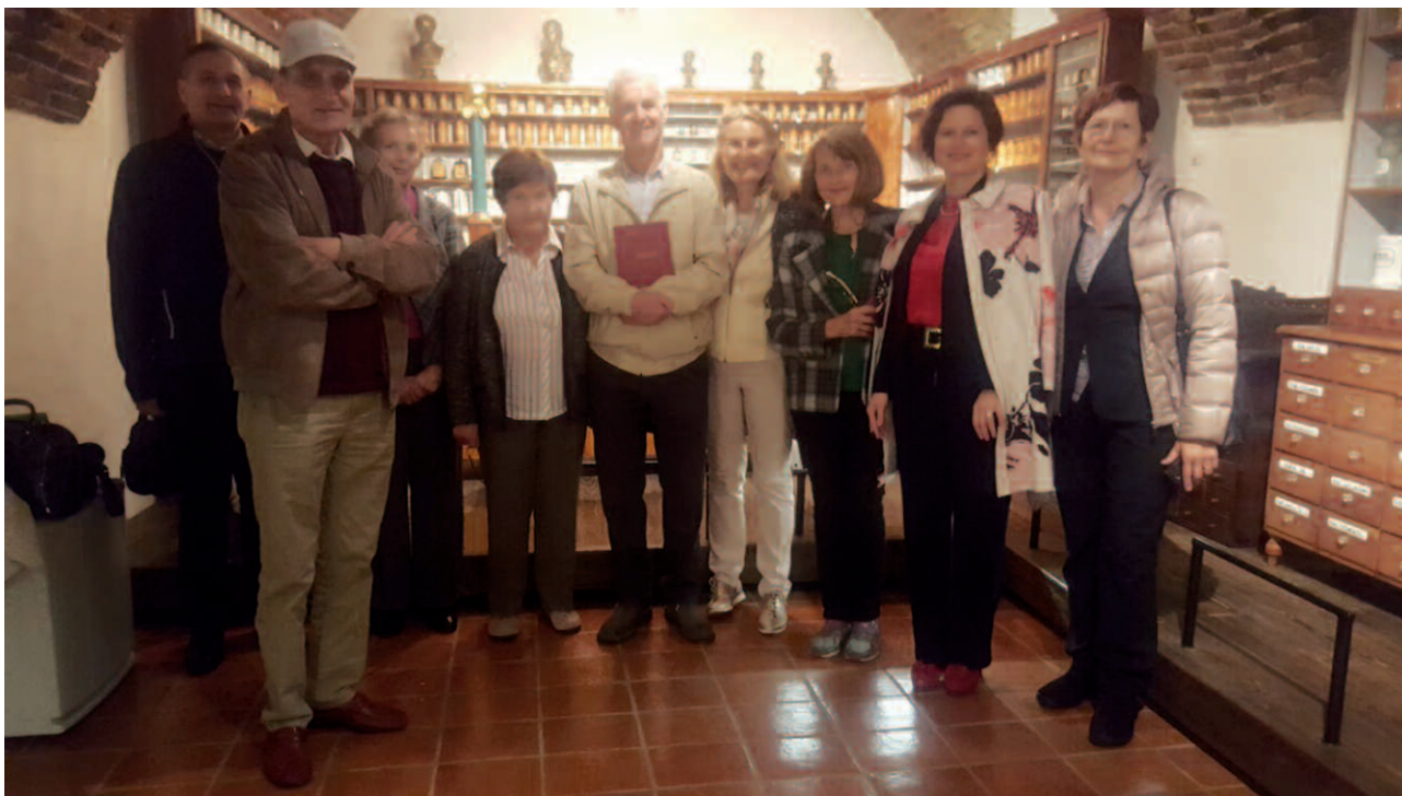
Udeleženci 3. strokovnega srečanja Sekcije za zgodovino farmacije v Pokrajinskem muzeju v Mariboru