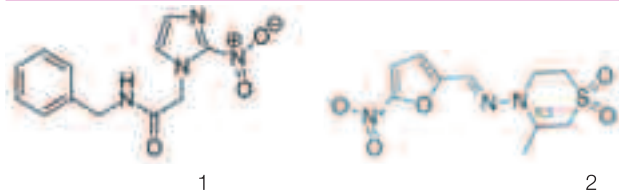
Slika 2: Strukturni formuli tripanocidnih učinkovin benznidazola (1) in nifurtimoksa (2).

Figure 2: Structural formulas of antitrypanosomal drugs benznidazole (1) and nifurtimox (2).