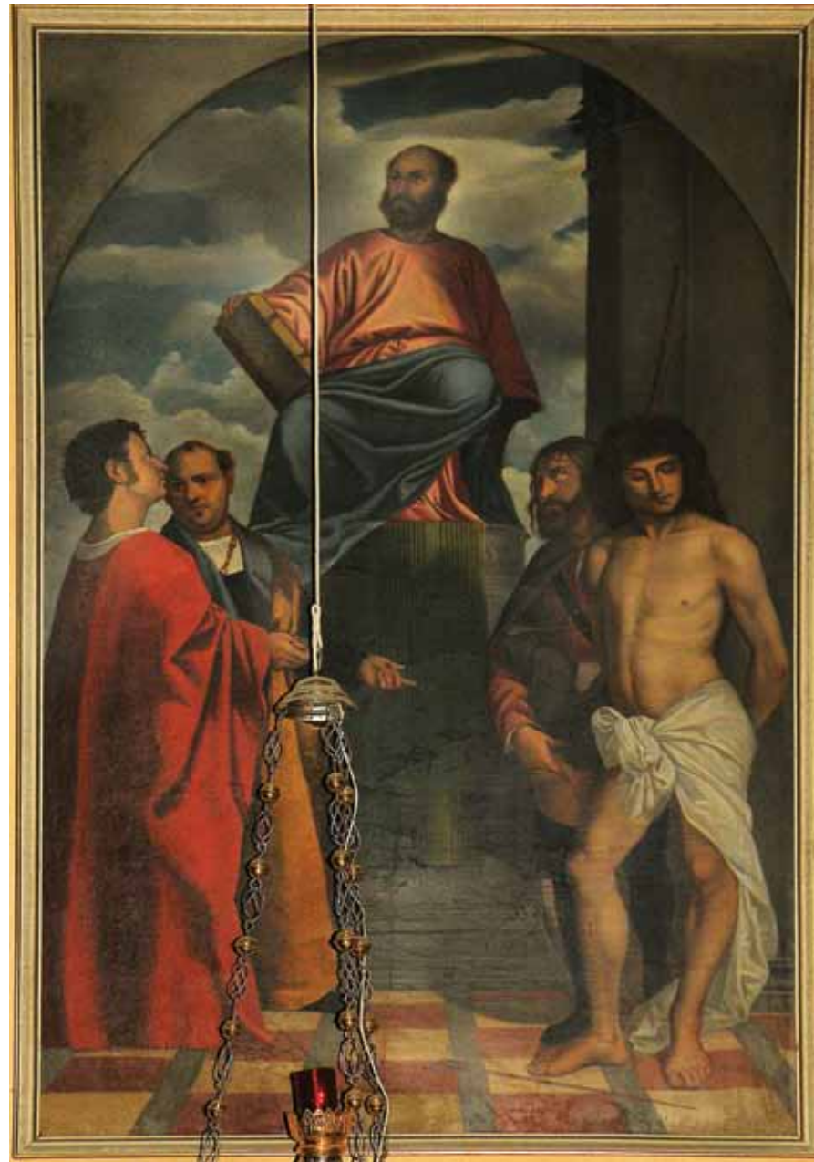
Slika 4: Slika v prezbiteriju ajdovske cerkve, foto: Vida Valič Fabčič.

Ajdovščina je največji kraj v zgornji Vipavski dolini. Sredi zahodnega dela mesta na nekdanjem rimskem pokopališču stoji župnijska cerkev sv. Janeza Krstnika. Prvič jo omenjajo leta 1507, vendar naj bi stala tu že v poznem srednjem veku. Zgradbo so večkrat prezidali, nazadnje v 18. stol., ko so jo tudi barokizirali (43, 44). V prezbiteriju na vzdolžnih stenah poleg slik Cebejevega križevega pota visijo še štiri slike. Največja (Slika 4, 230 × 150 cm) je kopija Tizianove slike iz cerkve Santa Maria della Salute v Benetkah. Kdo je oljno sliko na platnu naslikal, ni znano, nastala pa je v 19. stol. (44). Italijanski renesančni slikar Tiziano Vecellio je izvirnik naslikal v 16. stol. v zahvalo ob koncu epidemije kuge (45). Na vrhu slike na prestolu v poltemi sedi sv. Marko. Desno pod njim stojita sv. Sebastijan in sv. Rok (pri slednjem naj bi šlo za Tizianov avtoportret), levo pa sv. Kozma in Damjan. Svetnik v rjavem plašču z rdečim vzorcem s prstom kaže proti svetnikoma na drugi strani in se ozira proti svojemu bratu. Ta je oblečen v rdeč plašč in drži srebrno posodico. Gleda sv. Marka na prestolu nad njimi. Oba svetnika zdravnika nosita zlat nakit: dobro je vidna bogata ogrlica pri enem, na palcu in prstancu obeh vidnih rok pa prstani.