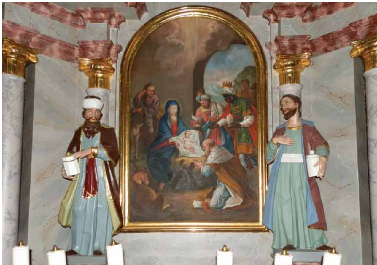
Slika 5: Stranski oltar v cerkvi v Bevkah, foto: Vida Valič Fabčič.

Bevke so razpotegnjeno naselje ob treh osamelcih na zahodnem delu Ljubljanskega barja. Sredi strnjenege dela vasi na nižjem delu osamelca Brdo stoji župnijska cerkev Povišanja sv. Križa. Prvič jo omenjajo leta 1528. Od takratne zgradbe ni vidnih ostankov. Sedanja cerkev je bila zgrajena v 17. stol., v drugi polovici 18. stol. so jo povečali in barokizirali. Cerkev sestavljajo ovalna ladja, pravokoten prezbiterij z glavnim oltarjem in še dve stranski kapeli z oltarjema iz prve polovice 19. stol. (46) V kapeli na desni strani je oltar s sliko obiska sv. Treh kraljev pri novorojenem Jezusu (Slika 5). Ob straneh sta pozlačena in polihromirana kipa sv. Kozme in Damjana visoka približno 60 cm. Svetnik na levi drži nenavadno osemkotno posodo s pokrovom in ima na glavi turban. Svetnik na desni drži ovalno posodo za mazila, desnico ima naslonjeni na prsi in oči upira kvišku. Oba sta oblečena v dolgo tuniko in plašč ter sta prepasana.