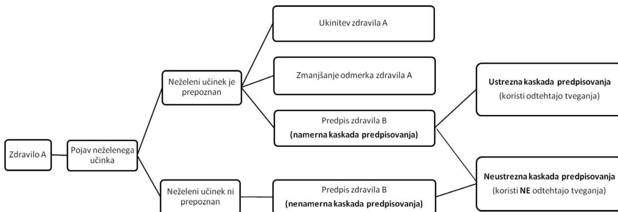
Slika 2: Različne vrste kaskad predpisovanja zdravil. Prirejeno na podlagi McCarthy in sod., 2019 (5). Figure 2: Different types of prescribing cascades. Adapted from McCarthy et al., 2019 (5).

skadami predpisovanja. Večinoma kaskade smatramo kot posledico zdravljenja neželenega učinka, vendar je lahko drugo zdravilo predpisano tudi preventivno, kot npr. zaviralci protonske črpalke, ki jih uporabljamo za preprečevanje gastrointestinalnih neželenih učinkov, povzročenih z nesteroïdnimi antirevmatiki (7).