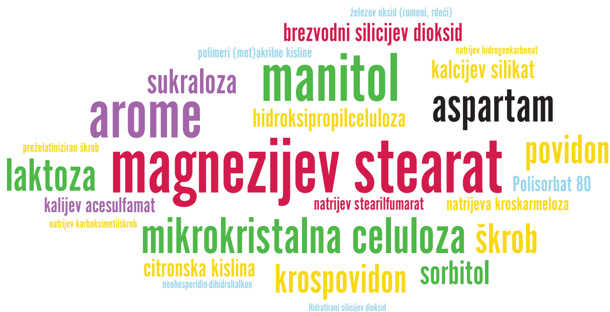
Slika 2: Najpogostejše pomožne snovi v orodisperzibilnih tabletah na slovenskem trgu; velikost besede na sliki je sorazmerna s frekvenco pojavnosti v izdelkih. Rdeča – drsilo, mazivo, antiadheziv; zelena – polnilo; rumena – razgrajevalo; rožnata – pomožna snov za izboljševanje okusa; modra – drugo. Slika je bila generirana na spletni strani https://www.wordclouds.com/ .