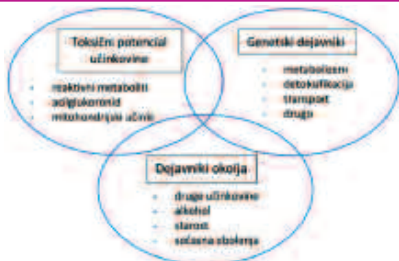
Slika 1: Dejavniki tveganja za hepatotoksično reakcijo (10, 21).

Klinični obseg z zdravili povzročene jetrne okvare je lahko zelo različen, vse od asimptomatskega, blagega povišanja serumskih vrednosti jetrnih transaminaz do akutne jetrne odpovedi. Huda jetrna okvara je opredeljena z 10 x povečanjem vrednosti serumskih koncentracij jetrnih transami-