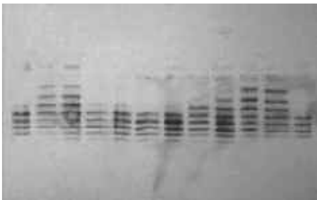
Slika 2: Analiza vsebnosti eritropoetinov z izoelektričnim fokusiranjem neprimerljivih bioloških zdravil iz Indije, Južne Koreje, Kitajske in Argentine v primerjavi z eritropoetinom alfa (zadnji desni stolpec). Povzeto po 10)

skupino bioloških zdravil, za podobna biološka zdravila. Neprimerljiva biološka zdravila se od inovativnih in podobnih bioloških zdravil razlikujejo predvsem po večjih odstopanjih od učinkovitosti in kakovosti ali pa so podatki o primerjalnih testih z referenčnim biološkim zdravilom pomanjkljivi. Vse to lahko vodi do vprašljive varnosti. V nekaterih državah izven ZDA in EU je namreč dovoljen nacionalni postopek pridobitve dovoljenja za promet. To velja za večino azijskih držav, Rusijo, Turčijo, Bosno in Hercegovino, Makedonijo, Srbijo, Albanijo in nekatere južnoameriške države. Na sliki 2 so razvidne strukturne razlike neprimerljivih bioloških eritropoetinov v primerjavi z inovativnim eritropoetinom alfa. V delu, ki se nanaša na kakovost morajo biti izvedene natančne primerjalne analize in funkcionalne študije med referenčnim biološkim zdravilom, ki mora biti inovativnega izvora in podobnim biološkim zdravilom. V primeru neprimerljivih bioloških zdravil gre običajno za pomanjkljivo dokumentacijo v kakovostnem delu ali pa v kliničnem delu v povezavi s primerjalnimi testi in študijami. Tudi znotraj EU obstajajo primeri neprimerljivih bioloških zdravil, ki so bila razvita še pred uvedbo regulatornih smernic EMA in so jih proizvajalci izvažali v države izven EU (12,13).